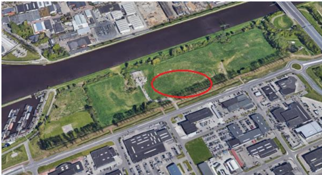
Foto: terrein aan Sint Petersburg. In de rode cirkel komen wooncontainers voor de noodopvang.